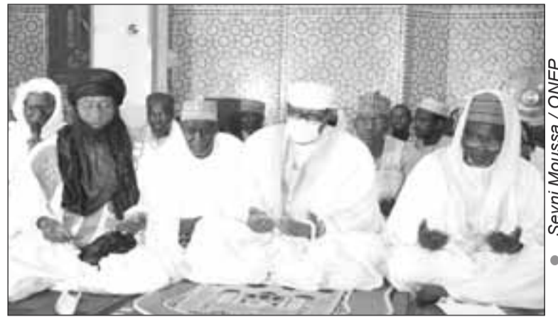
... communiant avec les oulémas et de nombreux fidèles

l'anniversaire du prophète de la miséricorde, Mohamed (PSL) est une grande occasion « qui nous est offerte pour réfléchir et méditer sur nos comportements dans le contexte de la vie actuelle afin de comparer et peser cela sur la balance de ce miraculeux hadith du prophète, rapporté par Buhari et Mouslim qui dit : « l'exemple des croyants dans leurs amours mutuels, dans leur solidarité et dans leur tolérance est similaire à l'organisme. Tant qu'un organe se plaint tous les autres membres du corps sont affectés ». Pour cette occasion, l'intégralité du saint Coran a été lue, suivi d'une fatiha (prières et invocations) pour que la paix, la stabilité, la cohésion sociale, la prospérité et la miséricorde de Dieu couvrent l'humanité en général et notre pays le Niger