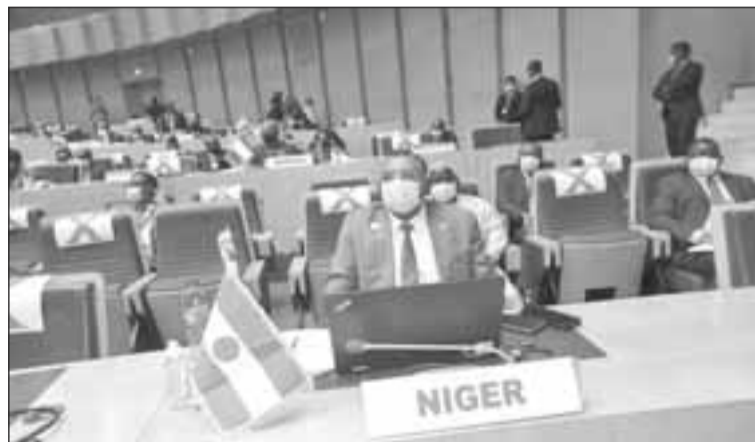
Le ministre délégué Youssouf Mohamed El Moctar

de quelques organes notamment la commission africaine des droits de l'homme et des peuples, le conseil consultatif de l'Union Africaine sur la corruption ou encore au niveau de l'université panafricaine. Ainsi, toutes ses instances citées sont désormais dotées de personnes ressources qui auront la charge d'animer les activités dans les différents départements. Au cours des débats parfois houleux, les ministres des affaires étrangères des pays membres de l'Union Africaine ont su dépasser leurs différences et autres oppositions en examinant avec la plus