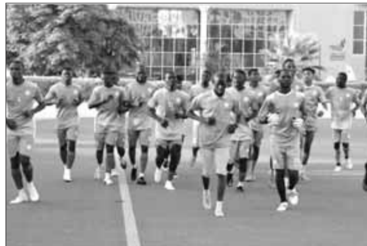
L'équipe nationale du Niger