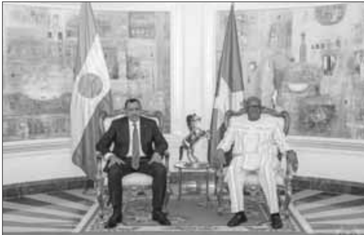
L'entretien entre le Président Bazoum et son homologue Kaboré

14. Dans le cadre bilatéral, les deux Chefs d'Etat ont exprimé leur satisfaction quant aux liens séculaires d'amitié, de fraternité, de solidarité et de coopération qui ont toujours caractérisé leurs relations et se sont engagés, en