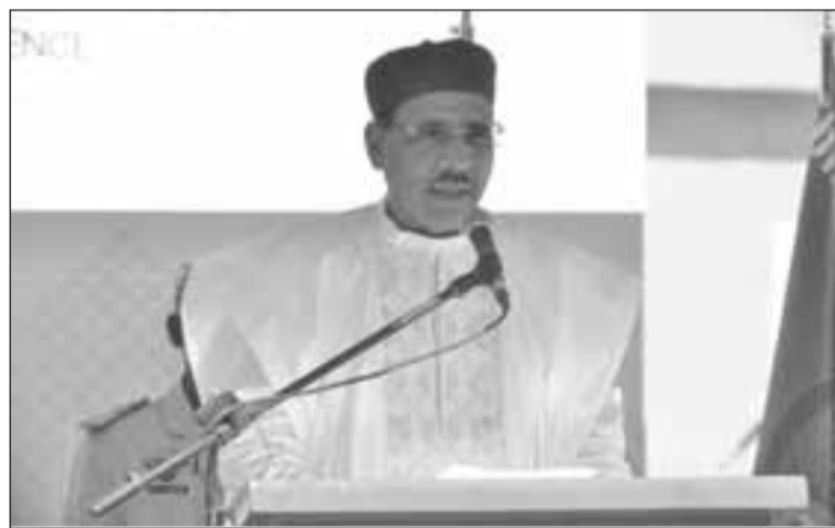
Le Chef de l'Etat lors du lancement de la rentrée à l'EMS Niamey

Le terrorisme que notre armée combat est certes un phénomène sous-régional, mais notre pays, du fait de la centralité de sa position géographique au Sahel, se situe pour ainsi dire dans l'épicentre du périmètre où sévit ce fléau, à la frontière des deux grands foyers originels que sont le nord Mali et le bassin du lac Tchad. Nous sommes par ailleurs, on a souvent tendance à l'oublier, un pays frontalier de la Libye, ce pays frère qui peine à disposer de forces de défense et de sécurité le long de la frontière que nous avons en partage. Sa partie méridionale est, depuis une décennie, une zone d'anomie où prospèrent des groupes armés non étatiques et avec eux la criminalité transfrontalière organisée inondant le Sahel des armes les plus sophistiquées, en quantités infinies et à vil prix. Malgré l'ampleur de ces défis aggravés par ailleurs par l'étendue de notre territoire et la multiplicité des foyers ayant commandé de nombreuses opérations, notre pays est resté admirablement stable, solide sur ses bases. Nous devons cela à la gouvernance sécuritaire telle que promue par les présidents Tandja Mamadou et Issoufou Mahamadou chacun à leur