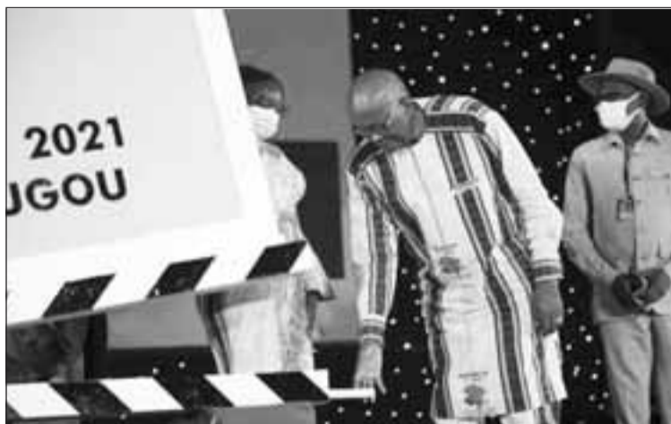
Le Président du Faso donnant le clap d'ouverture du FESPACO

Initialement prévue du 27 février au 6 mars, la 27 ème édition du Festival panafricain du cinéma et de la télévision de Ouagadougou (FESPACO) avait été repoussée de plusieurs mois du fait de la crise sanitaire de Covid19, pour se tenir finalement du 16 au 23 octobre 2021. Le Président du Faso, M. Roch Marc Christian Kaboré a donné, le 16 octobre dernier, le clap d'ouverture de cette édition placée sous le thème "Cinéma d'Afrique et de la diaspora : nouveaux regards, nouveaux défis". C'était lors d'une cérémonie riche en son et image qui s'est déroulée dans l'enceinte du Palais des Sports de Ouaga 2000, en présence d'un public massivement mobilisé malgré les mesures prises pour des raisons sanitaires et sécuritaires.