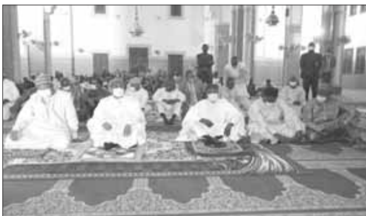
Les autorités présentes à la mosquée des grandes prières ...

ler à méditer et à comprendre que les difficultés et les problèmes contemporains auxquels on est confronté ne sont que des résultats de la méconnaissance des principes de l'Islam. Par ailleurs, il a rappelé que, la commémoration de