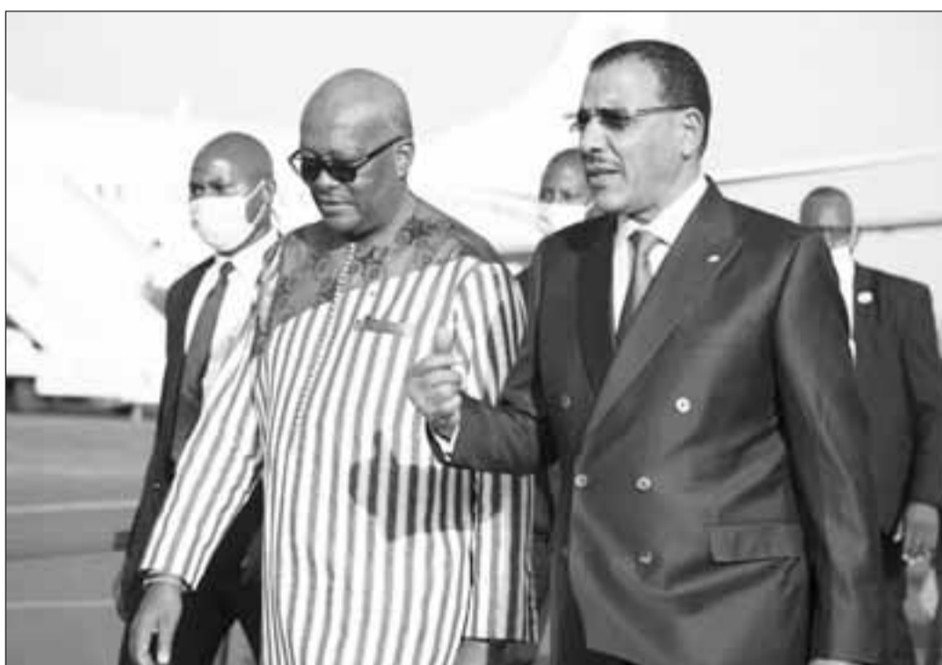
Le Président Bazoum chaleureusement accueilli par son frère Roch M. Kaboré

Le Président de la République, chef de l'Etat SE M. Mohamed Bazoum a regagné Niamey hier après avoir effectué les 17 et 18 octobre 2021 une visite de travail et d'amitié au Burkina Faso. A sa descente d'avion, le Chef de l'Etat a été accueilli par le Premier ministre SE Ouhoumoudou Mahamadou. Dans la capitale du Pays des hommes intègres, le Chef de l'Etat et son homologue du Burkina Faso SE Rock Marc Christian Kaboré ont eu des échanges sur les préoccupations de nos deux pays en matière de défense et de sécurité. Ils ont abordé ce sujet d'intérêt commun sous