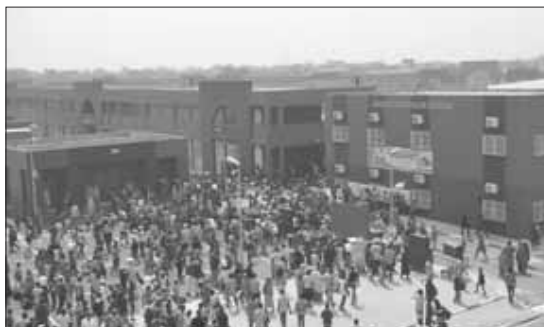
Une vue de l'esplanade du marché central moderne de Tahoua

males de confort, d'hygiène et de sécurité. Le ministre des Domaines, de l'Urbanisme et du Logement a affirmé que l'opérationnalisation de ce marché va booster l'économie, à travers l'amélioration des recettes fiscales de la région, et développer davantage les activités économiques avec des pays voisins. «La