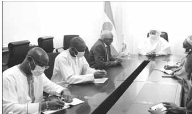
... celle de l'Union Africaine ...

gation n'aurait pas été confiée au chef du gouvernement nigérien leur a brossé la situation du pays par rapport à l'organisation et à la tenue du scrutin du 21 février 2021, "qui est très bonne dans l'ensemble". «Il nous a aussi présenté toutes les données relatives à