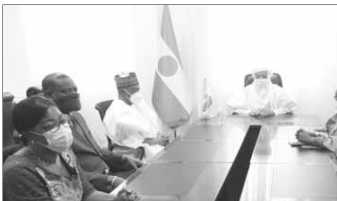
Le Premier ministre avec la délégation de la CEDEAO ...