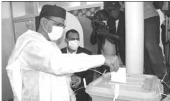
Le candidat Mohamed Bazoum a voté à Niamey