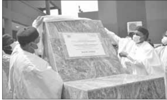
... dévoilant la plaque inaugurale ...

Domaines, de l'Urbanisme et du Logement, M. Waziri Maman, a indiqué que la réalisation de cet important projet n'a été possible que grâce à la détermination et l'engagement personnel du Président de la République, Chef de l'État, Issoufou Mahamadou. C'est en effet, a-t-il souligné, un marché moderne qui dispose de toutes les commodités permet aux usagers (commerçants et clients) de faire leurs transactions dans des conditions opti-