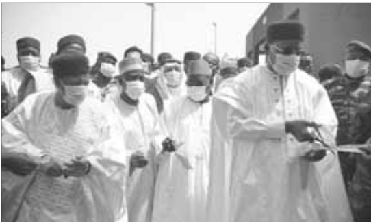
Le Président de la République coupant le ruban inaugural ...

Le Chef de l'État a tenu à exprimer ses attentes relativement à l'élection présidentielle du 21 février. «J'espère que cette élection sera transparente, comme l'ont été toutes les élections au Niger. Cela participe de ma promesse de consolider les institutions démocratiques dans notre pays», a-t-il déclaré. Enfin, le Chef de l'État s'est réjoui de la concrétisation de cette infra-