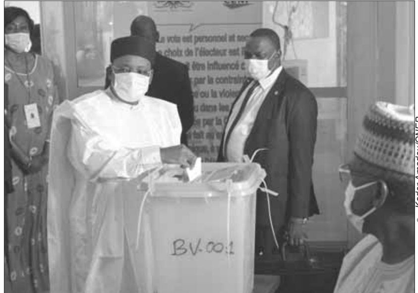
Le Président Issoufou Mahamadou a voté au Bureau n°001 de l'Hôtel de Ville

«L'alternance pacifique qui a manqué au Niger depuis des décennies va se réaliser» assure SE Issoufou Mahamadou