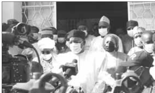
A sa sortie du Bureau de vote le Chef de l'Etat s'est confié aux médias

toujours fait partie de mes priorités et c'est suite à cela que je me suis employé depuis 10 ans à travers l'organisation des élections libres et transparentes comme le prouvent d'ailleurs les trois scrutins précédant celui du 13 et du 27 décembre 2020», a-t-il ajouté. SE Issoufou Mahamadou a indiqué que le 2 ème tour de l'élection présidentielle sera un scrutin libre et transparent, soulignant que l'alternance est en marche. «L'alternance pacifique qui a manqué au Niger, depuis