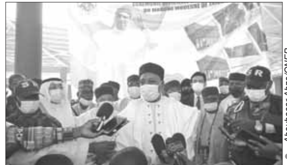
... et s'adressant à la presse

Le Président de la République a saisi cette occasion pour rappeler les importantes réalisations depuis son accession au pouvoir en 2011. Il s'agit, a-t-il cité, entre autres : des infrastructures routières, énergétiques, des télécommunications, de l'Initiative 3N, et aussi dans le domaine du capital humain, notamment l'éducation, la santé, l'accès à l'eau potable et la création d'emploi pour les jeunes. «Pendant cette décennie, le Niger a amorcé sa transformation. Mais il y a encore beaucoup de travail à faire pour faire progresser le pays, pour créer les conditions de son émergence», a reconnu le Chef de l'État. «Mon souhait le plus profond, le plus cher, c'est que le Niger connaisse encore des décennies et des décennies de stabilité. C'est