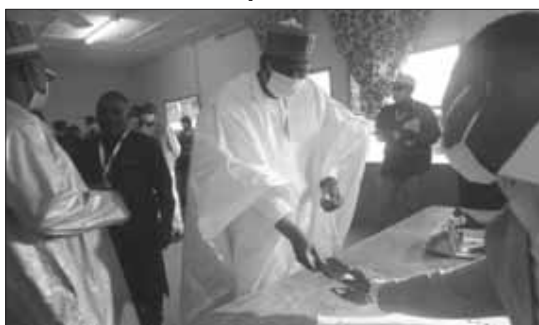
Le président de l'Assemblée nationale a voté à Dosso

Les 3178 bureaux de vote de la région de Dosso ont démarré, hier matin à 8 heures, les opérations de vote dans le cadre du 2 ème tour de l'élection présidentielle cela dans le strict respect des mesures barrières édictées par les plus hautes autorités de notre pays. Ils sont 898.794 électeurs appelés à accomplir leur devoir de citoyen au niveau des 43 communes que comptent les 8 départements de la région de Dosso. Le lancement officiel a été donné au bureau n°1 à la Maison de la culture Garba Loga par le président de l'Assemblée Nationale, M. Ousseïni Tinni qu'accompagne le Secrétaire général du gouvernement de Dosso, M. Assoumana Amadou.