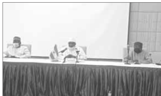
Le Médiateur de la République (au centre) lors de la cérémonie à Niamey

En effet, Mesdames et Messieurs, chers participants, l'acteur principal de demain, c'est le citoyen-électeur. De son civisme et de son sens de l'Etat dépend la crédibilité du scrutin, la vitalité de notre démocratie. De son comportement dépendra l'avenir immédiat de notre pays, de notre nation. Demain, c'est donc une journée pour la célébration et la magnificence de toutes les valeurs fondamentales : L'amour, le pardon, la paix, la compréhension mutuelle, la sérénité. A partir de cette célébration, nous irons vers une autre consécration, celle d'un grand label en démocratie contemporaine en Afrique. En effet, pour la première fois dans notre histoire sociopolitique, un Président démocratiquement élu, va passer la main à un autre, désigné selon les mêmes termes et procédures. Une véritable certifica-