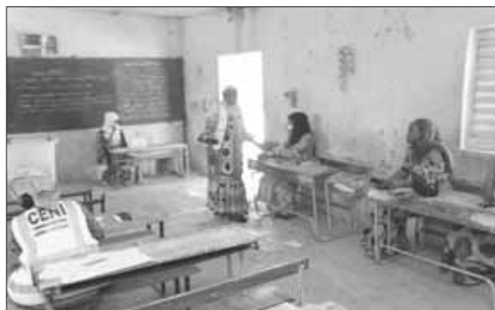
Dispositif dans un bureau de vote à Tillabéri ...

Tillabéri est l'une des régions affectées par l'insé-