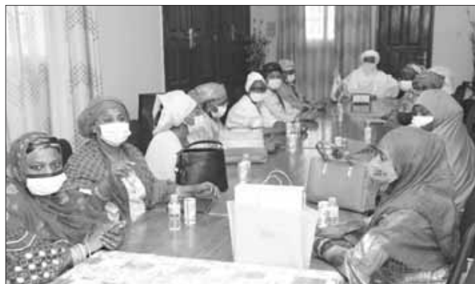
... et les femmes en service à son cabinet

L'émissaire de l'UA a précisé que la mission d'observation de l'UA est au Niger pour apporter sa contribution en veillant sur le déroulement de ces élections. «Nous étions ici lors du premier tour, les choses se sont pas-