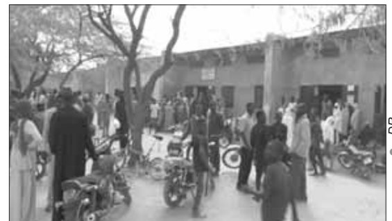
Une grande affluence au niveau de plusieurs bureaux de vote