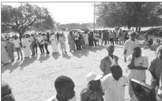
... et de l'ambiance dans la cour