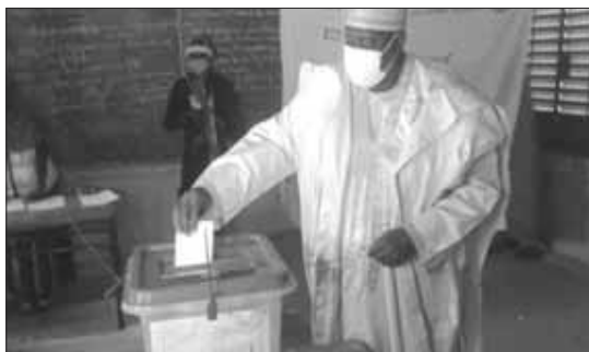
Le gouverneur de Maradi a voté au BV N°30