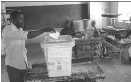
Un électeur au niveau d'un bureau de vote à Balléyara

A Ballayéra, l'on peut, au regard de l'affluence des électeurs ainsi observée, espérer un fort taux de participation à ce scrutin décisif.