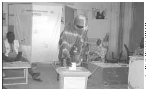
Un électricien exerçant son devoir citoyen

De l'autre côté, de l'espace public de l'OPVN où nous avons visité deux bureaux de vote, en l'occurrence le n°90 et le n°93, malgré le soleil ardent de 14h, femmes, hommes et jeunes venaient accomplir leur de-